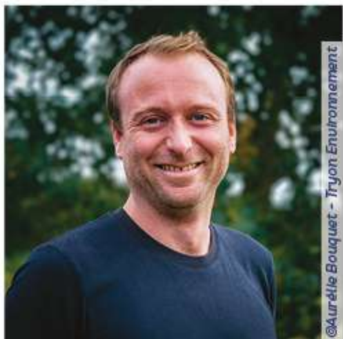
@Aurélie Bouquet - Tryon Environnement