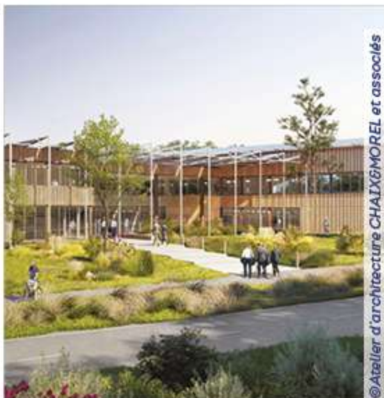
© Atelier d'architecture CHAIX&MOREL et associés

D'ici janvier 2026, une centaine de personnes travaillera dans ce nouveau bâtiment qui a déjà obtenu la médaille de bronze du label « Bâtiments Durables Nouvelle-Aquitaine » et qui représente un investissement de 9 millions d'euros pour Limoges Métropole.